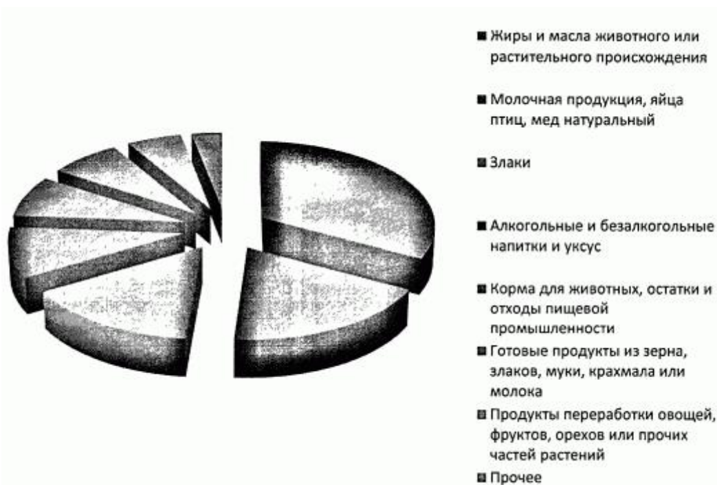
Рисунок 2. Структура экспорта продовольственных товаров и сельскохозяйственного сырья для их производства Республики Адыгея в 2020 году

На рисунке 2 представлена структура экспорта продовольственных товаров и сельскохозяйственного сырья для их производства.