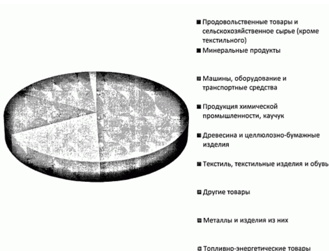
Рисунок 1. Товарная структура экспорта Республики Адыгея за 2020 год

В Республике Адыгея с долей 99,87% преобладает несырьевой неэнергетический экспорт. На диаграмме представлена товарная структура экспорта Республики Адыгея за 2020 год.